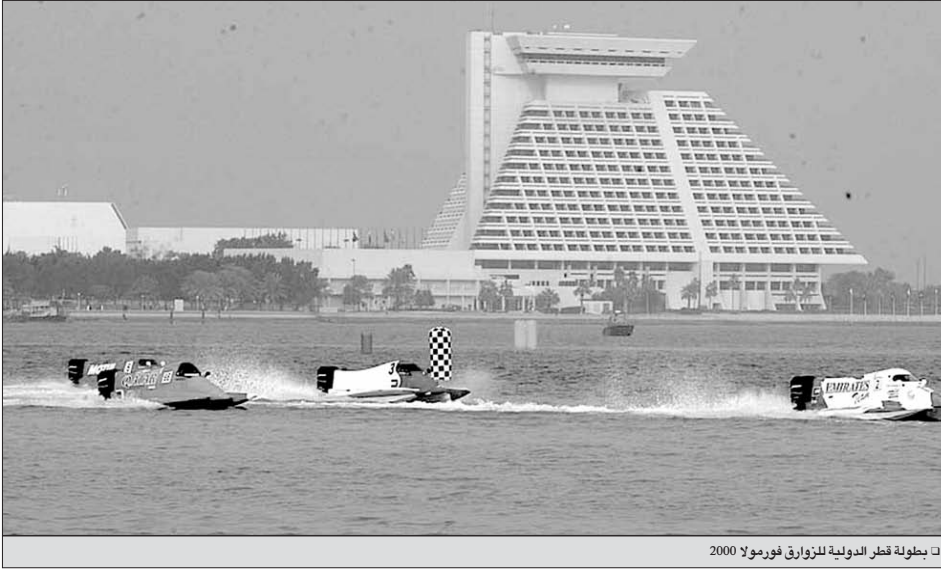
بطولة قطر الدولية للزوارق فورمولا 2000